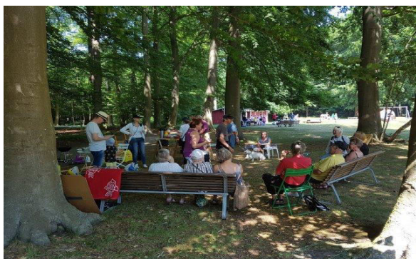
Ulkoilupäivä kesäkuussa, grillauskielto! Friluftsdagen i juni. Grillnings förbud !