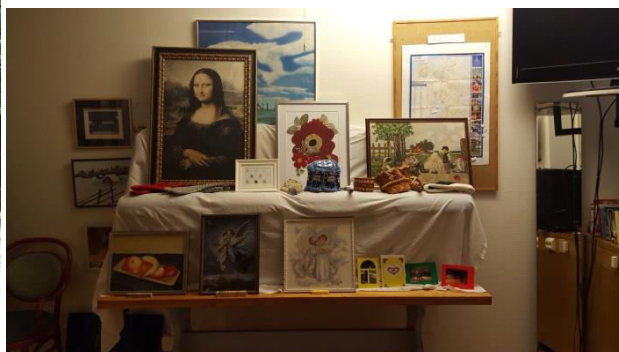
L:nan kulttuuriyö lokakuussa. Jäsenien taidenäytteitä esillä seuralla. Konstutst. i oktober.