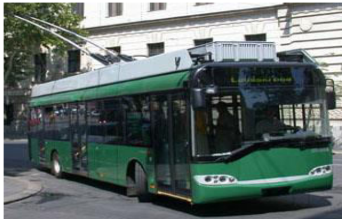
Johdinbussi nro 3 tuo perille Trådbussen nr 3 kommer fram

Landskronan Suomiyhdistyksen kevätkokoukseen sunnuntaina 10.3.2019 klo 15.00. Esillä sääntömääräiset asiat. Kahvitarjoilu.